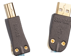
Kontakte für Lötanschluss